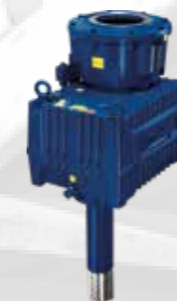
Hansen M4 ACC · Entraînements pour condenseur à air