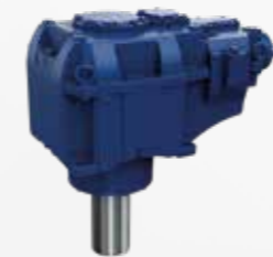
Hansen P4 · Réducteur vertical multi-étagé