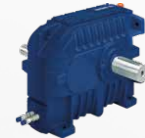
Hansen P4 · Réducteur mono-étagé