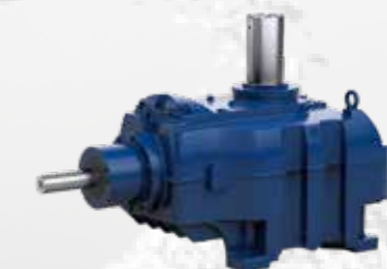
Hansen M5CT · Entraînements pour technologie de refroidissement