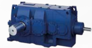
Hansen P4 · Réducteur horizontal multi-étagé